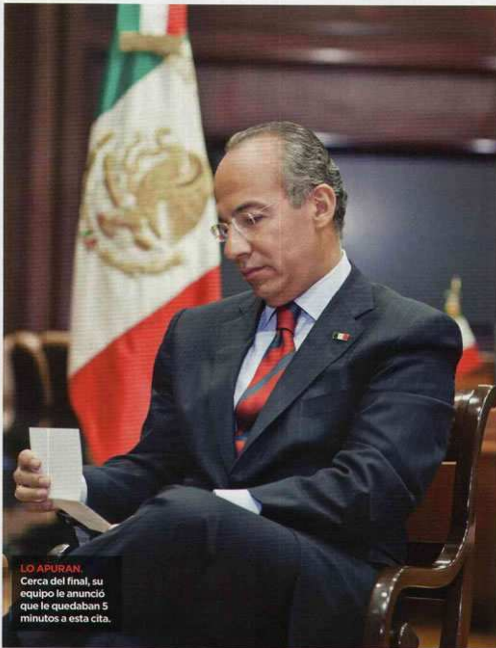
LO APURAN. Cerca del final, su equipo le anunció que le quedaban 5 minutos a esta cita.